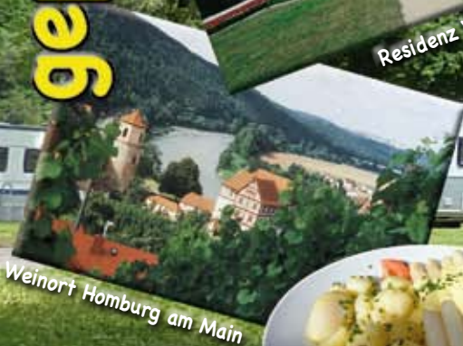
Weinort Homburg am Main