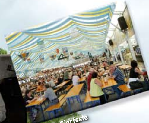
Wein- & Bierfeste