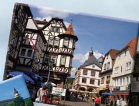
Lohr a. Main