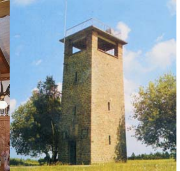
Rund um den Gasthof befinden sich schöne Aussichtstürme mit einzigartigen Ausblicken, den Spessart entdecken . . . .